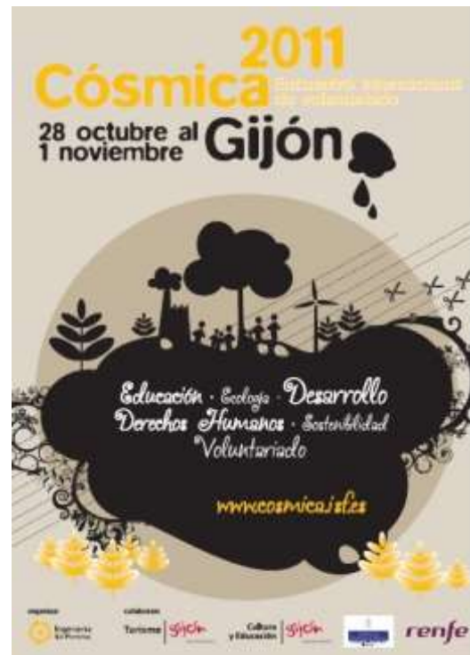
Cartel de la Cómica