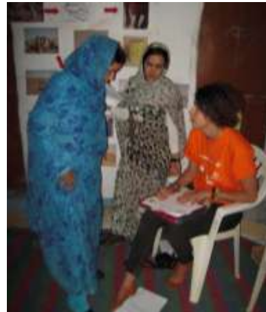
Curso de gestión de residuos