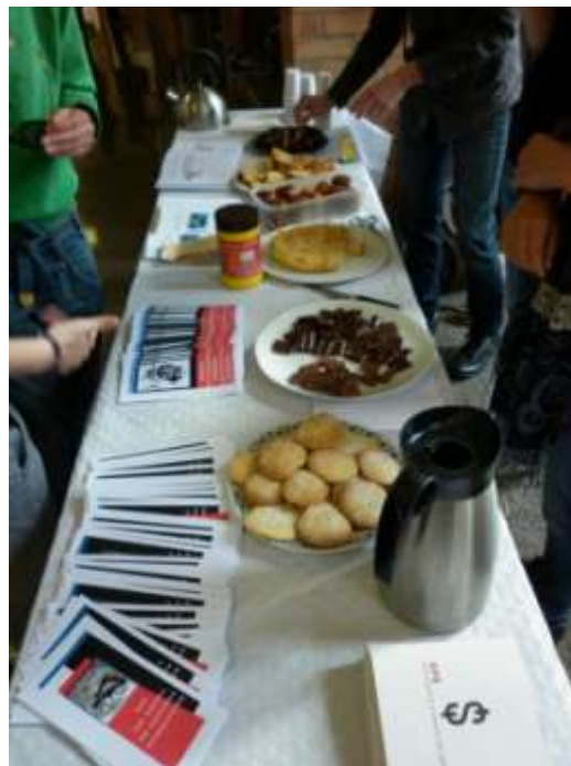
Jornadas de sensibilización en la Universidad de Oviedo

Respecto a la investigación para el desarrollo, hemos seguido apoyando una tesis doctoral y una revista académica sobre desarrollo rural de una universidad colombiana. En el VI Congreso de RULESCOOP (Red Universitaria Eurolatinoamericana en Estudios Cooperativos y de Economía Social) celebrado en San Gil (Colombia), presentamos tres comunicaciones, sobre promoción del cooperativismo y desarrollo, evaluación de proyectos de ONGD y fomento del emprendimiento asociativo en Camerún.