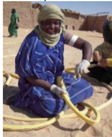
Reparación de una manguera en Smara