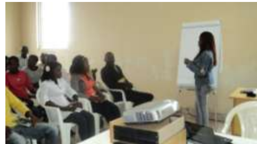
Fomento del emprendimiento en Angola