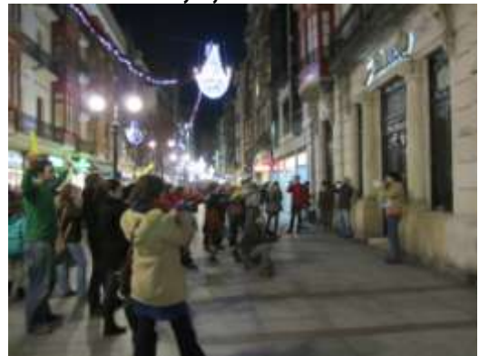
Denunciando los vínculos entre nuestros bancos y la industria armamentística