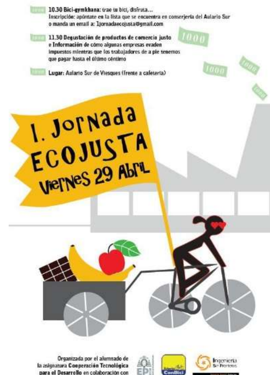
Cartel de las jornadas Ecojustas

A lo largo del año se han realizado otras actividades de formación, como una visita a COGERSA, un taller de género y un taller de gestión del correo electrónico.