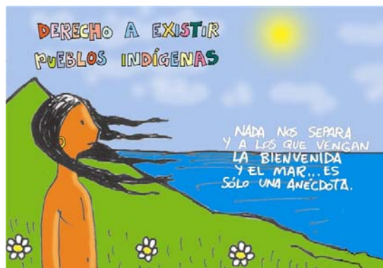
Una de las viñetas del mural