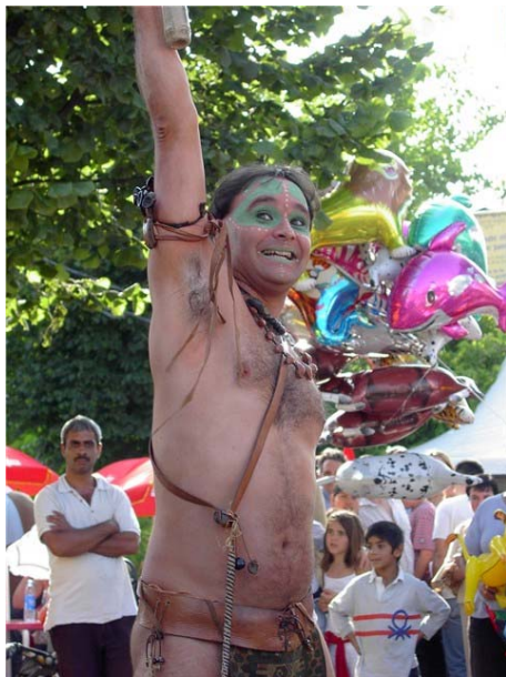
Otiacicoh (Oihulari Klown)

Esta campaña también dio continuidad al trabajo iniciado en 2003.