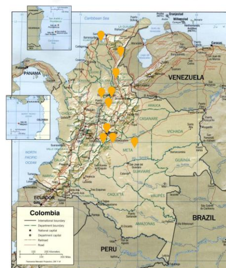
Itinerario de la XI Visita de verificación de DDHH.